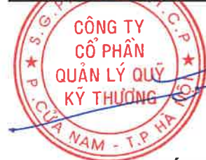
PHÍ TUẤN THÀNH