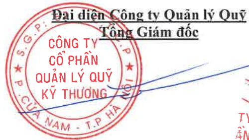
PHÍ TUẤN THÀNH