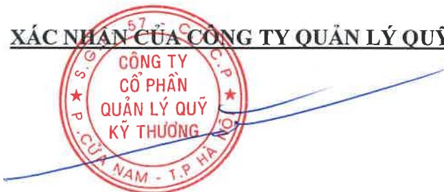
PHÍ TUẤN THÀNH