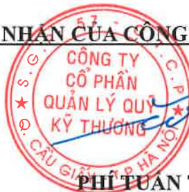
PHÍ TUẤN THÀNH