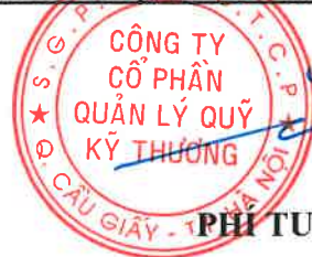
PHÍ TUẤN THÀNH