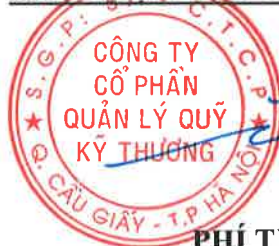
PHÍ TUÂN THÀNH