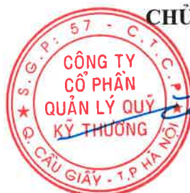
TỔNG GIÁM ĐỐC CÔNG TY CỔ PHẦN QUẢN LÝ QUỸ KỸ THƯƠNG