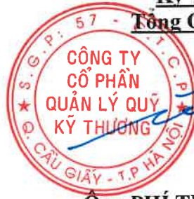
Ông PHÍ TUẤN THÀNH