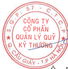
Ông PHÍ TUẤN THÀNH