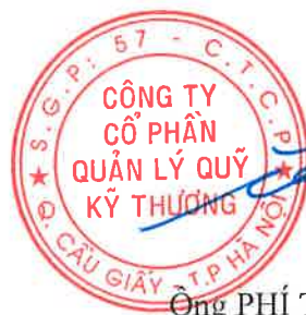
Ông PHÍ TUẤN THÀNH