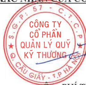
Ông PHÍ TUẤN THÀNH