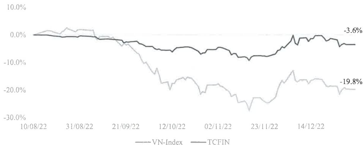
Tỷ suất lợi nhuận của TCFIN và VN-Index

Trong bối cảnh thị trường chứng khoán trải qua một năm khó khăn, Quý đã chủ động giảm tỷ trọng cổ phiếu và đầu tư tập trung vào các cổ phiếu có nền tảng cơ bản tốt, triển vọng kinh doanh khả quan trong ngành Tài chính và Ngân hàng. Tính đến ngày 31/12/2022, Quý nắm giữ 10 cổ phiếu, chiếm tỷ trọng khoảng 41% và giá trị Tài sản ròng trên chứng chỉ quỹ (NAV/CCQ) đạt 9,642 đồng, giảm 3.6% so với kể từ khi thành lập (cùng kỳ VN-Index giảm 19.8%).