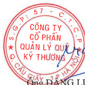
Ông ĐẶNG LƯU DŨNG