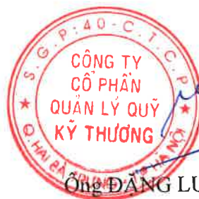
Ông ĐĂNG LƯU DŨNG