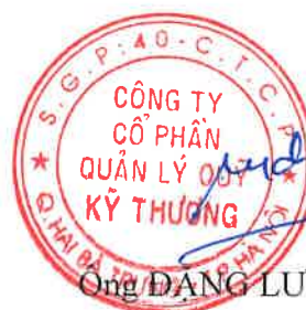
Ông ĐẶNG LƯU DŨNG