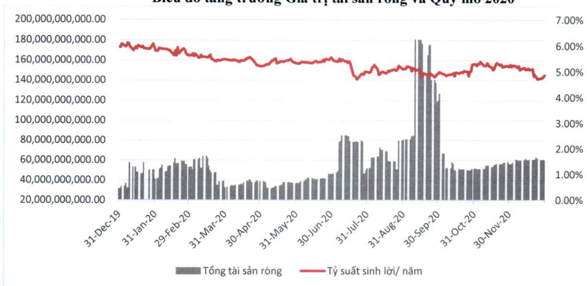
Biểu đồ tăng trưởng Giá trị tài sản ròng và Quy mô 2020

Trong năm 2020, NHNN đã thực hiện một loạt các giải pháp đồng bộ như hạ lãi suất điều hành, điều tiết cung tiền dồi dào hay tiến hành cơ cấu lại nhóm nợ, giãn nợ cho đối tượng doanh nghiệp ưu tiên, cụ thể, NHNN đã hạ lãi suất OMO tổng cộng 3 lần trong năm, với biên độ tổng cộng 1,5% về mức thấp nhất trong lịch sử (2,5%/năm), trần lãi suất tiền gửi ngắn hạn tại các Ngân hàng thương mại liên tục được điều chỉnh giảm (tiền gửi không kỳ hạn và có kỳ hạn dưới 6 tháng giảm từ 4.75% xuống còn 4.5%). Trong khi đó, quỹ TCCF vẫn duy trì quy mô cũng như lợi tức ổn định (5-6%/năm). Với việc các doanh nghiệp bị ảnh hưởng bởi đại dịch Covid-19 chưa thể giải ngân vào hoạt động sản xuất kinh doanh thì kênh đầu tư vào chứng chỉ quỹ TCCF đem lại lợi suất vượt trội so với lãi suất tiền gửi cùng kỳ hạn. Điều này cho thấy niềm tin của nhà đầu tư đối với công ty Quản lý Quỹ Kỹ Thương trong vai trò cung cấp giải pháp đầu tư giúp tối ưu hoá vốn lưu động của Doanh nghiệp.