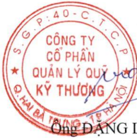
Ông ĐẶNG LỮU DŨNG